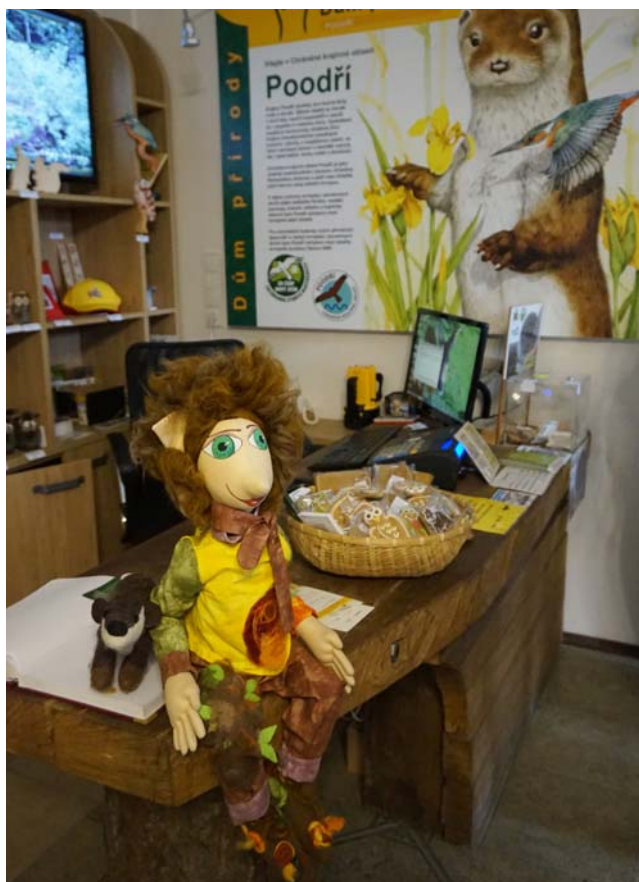
Domem přírody v Poodří malé návštěvníky provází Kulíšek.

Cílem společného projektu Gminy Krzyżanowice, obce Šilheřovice a města Bohumím, realizovaného v roce 2017, bylo zvýšení atraktivity přírodního dědictví česko-polského příhraničí a zároveň jeho zpřístupnění co nejširšímu okruhu návštěvníků. V rámci projektu, na který byla z programu INTERREG V-A Česká republika-Polsko schválena dotace ve výši 446 166 EUR, byla v přírodní oblasti meandrů řeky Odry vybudována rozhledna, byla realizována rekonstrukce částí naučných stezek a na obou stranách hranice byly pro návštěvníky zřízeny cykloboxy pro bezpečnou úschovu kol.