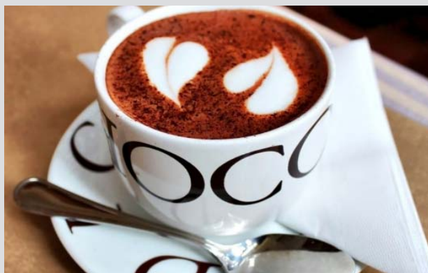
Jeden z workshopů byl zaměřen na baristiku, tedy na vše, co souvisí s kávou.

Hlavním cílem projektu bylo vytvoření moderního vzdělávacího systému výuky, který by flexibilně reagoval na potřeby žáků, firem a podniků v oblasti cestovního ruchu, hotelnictví, gastronomie a trhu práce v česko-polském příhraničí. Projekt si kladl za cíl zpřístupnit českým a polským studentům nejnovější poznatky z praxe, v návaznosti na realizaci praktických workshopů s předními odborníky v oboru vytvořit moderní studijní podklady, dovybavit učebny pro praktickou výuku žáků, prohloubit spolupráci s podniky a zajistit jejich větší angažovanost při realizaci vzdělávání na partnerských středních školách a v neposlední řadě také zvýšit atraktivitu studijního oboru cestovní ruch, hotelnictví a gastronomie. V rámci projektu byly mj. realizovány společné vzdělávací workshopy zaměřené na výuku odborných předmětů jako např. stolování, barmanství, baristika, sommeliérství či hotelový provoz. Z každého workshopu vznikla odborná případová studie, zpracovaná ve spolupráci odborných pedagogů a lektorů, kteří jednotlivé workshopy vedli. Vznikly tak hodnotné materiály pro výuku na obou partnerských školách.