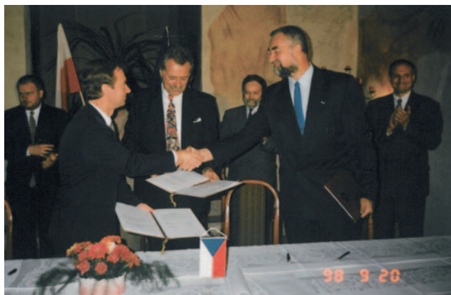
20. září 1998 v Moravské kapli bývalého dominikánského kláštera v Opavě byla slavnostně podepsána smlouva o založení Euroregionu Silesia.