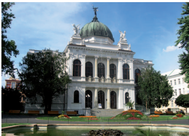
Slezské zemské muzeum v Opavě, založené v roce 1814, je nejstarším muzeem na území České republiky.

Euroregion Silesia svým názvem navazuje na latinské pojmenování Slezska – SILESIA. Slezska, které jako historická země zaujímá oblast ležící nyní na území tří států: Polska, České republiky a v malé míře i Německa. Území Slezska je vyobrazováno často jako dubový list, jehož nervaturu tvoří řeka Odra ve svém horním a středním toku a její přítoky. V tomto nástinu se pokusíme ukázat, jak došlo k tomu, že tento dubový list je dnes „roztržen“ mezi Polsko a Českou republiku. Zaměříme se samozřejmě na česko-polské a přesněji slezsko-moravské pomezí, respektive území, které je dnes ve velké míře totožné s územím Euroregionu Silesia.