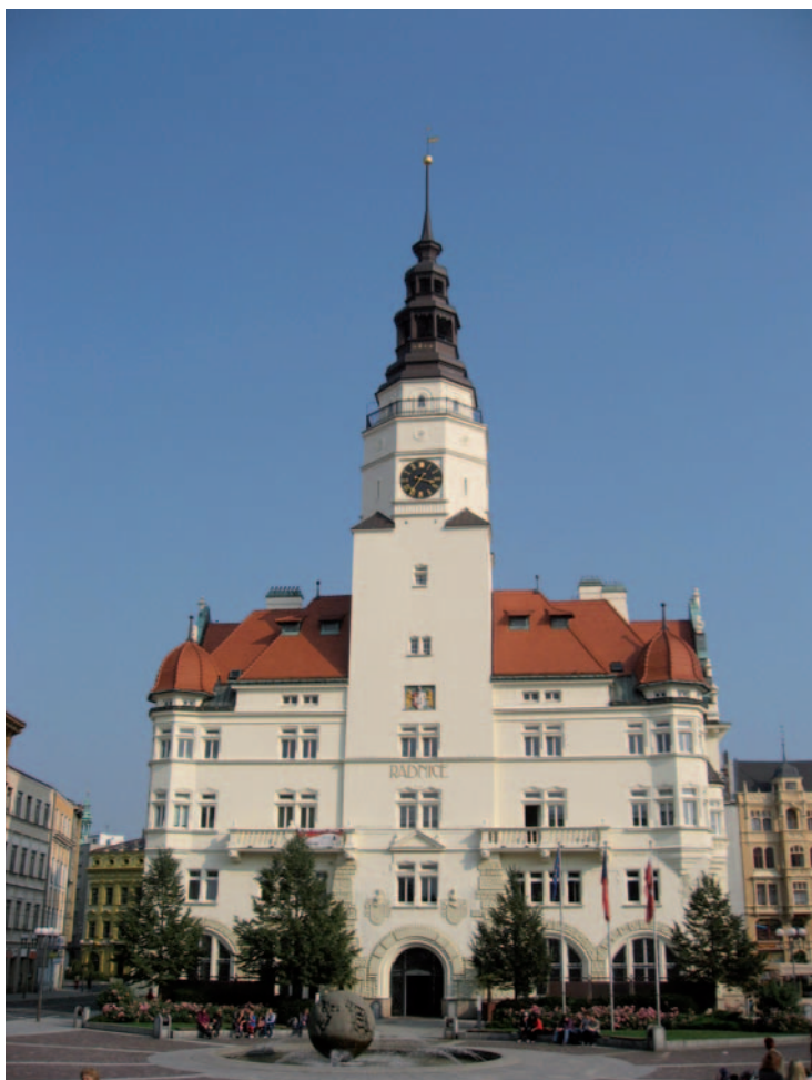
Městská věž zvaná „Hláška“, vybudovaná v letech 1614-1618, je symbolem města Opavy. Je sídlem magistrátu města a také české části Euroregionu Silesia. Věž je přístupná veřejnosti.

Po úvodní analýze při zpracování Strategie bylo jasné, že na našem území je již několik rozhleden a vyhlídek přístupných pro návštěvníky. Všechny ale fungovaly jako „samostatné“ atraktivity, nepropojené do jednoho celku. Dále se ukázalo, že řada našich obcí chce stavět nové rozhledny nebo vyhlídky, případně zrekonstruovat stávající objekty a zpřístupnit je návštěvníkům. A tak v roce 2016 Euroregion Silesia připravil souhrnnou koncepci vytvo-