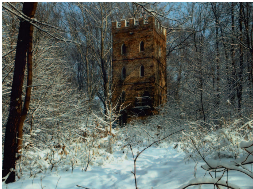
Rytířská bašta ve Wodzisławiu Śląském bude návštěvníkům přístupná pro své rekonstrukci plánované v letech 2020-2021.

ření rozhleden a vyhlídkových míst na různých místech euroregionu, která je postupně realizována v podobě více projektů. Nejprve byly připraveny tři skupiny projektů do Fondu mikroprojektů (v rámci 1., 2. a 3. etapy), celkem 11 žádostí na „malé“ rozhledny a vyhlídky. Malé však jen finančním objemem, protože myšlenka celé koncepce je jedna – velká. Další rozhledny, jako má být ta ve Wodzisławiu, Budišově nad Budišovkou nebo v Jeseníku nad Odrou, vyžadují větší finanční náklady mimo rámec Fondu mikroprojektů. Proto budou součástí jednoho velkého projektu, tzv. „Silesianky“, který je v současné době připravován a který by měl všechny rozhledny a vyhlídková místa – již existující i ta nově vybudovaná – spojit do jednoho uceleného turistického produktu. A protože musí být někdo, kdo bude dohlížet na vše jako celek a bude koordinovat jednotlivé činnosti (včetně propagace a uvedení nově vytvořeného produktu do života), bylo jasné, že tohoto úkolu se zhostíme my, dvě sdružení tvořící Euroregion Silesia.