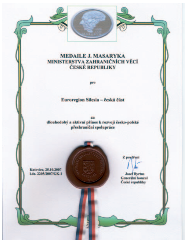
Za dlouhodobý a aktivní přínos k rozvoji česko-polské přeshraniční spolupráce obdržela česká i polská část Euroregionu Silesia vyznamenání Ministerstva zahraničních věcí ČR – Medaili Jana Masaryka.

Základní rámec pro další systematický rozvoj přeshraniční spolupráce a podporu činnosti subjektů realizujících přeshraniční spolupráci na území Euroregionu Silesia vytváří společný strategický dokument „Strategie rozvoje Euroregionu Silesia na období 2014-2020“. V současné době je vyhodnocováno, jak je tento dokument naplňován, a je prováděna jeho aktualizace s výhledem na období po roce 2020. Přestože v tuto chvíli je příprava na novou „evropskou sedmiletku“, tj. na nové finanční období 2021 – 2027 teprve ve svých počátcích, Euroregion Silesia již dnes analyzuje své aktuální i budoucí potřeby a možnosti tak, aby jeho strategická vize stála se „prosperujícím česko-polským regionem, který podporuje ideu evropské jednoty a společně rozvíjí svou budoucnost na základě partnerské spolupráce“ nebyla jen prázdnou definicí na papíře.