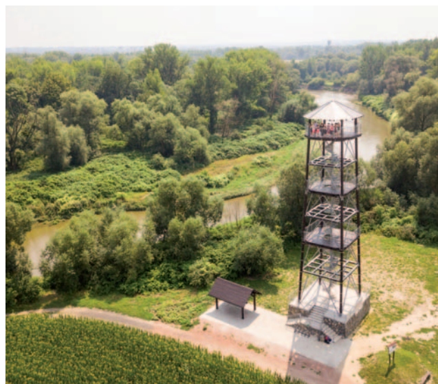
Rozhledna v Krzyżanowicích-Chałupkach (27 m) nabízí výhled na řeku Odru a její meandry.